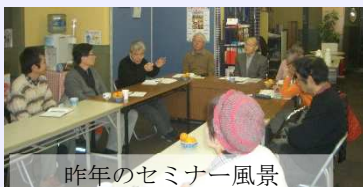
昨年のセミナー風景

歴史や語学の趣味を活かして、資料館や在日外国人支援のNPOでボランティアとして活躍中。