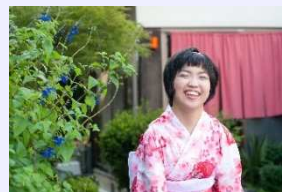
できあがりの写真！

コストを抑えながらも、プロとしてヘアメイク・衣装から撮影までの一連の作業を考えると撮影会がベストなので、まずは、撮影会の回数を増やしていきたいです。