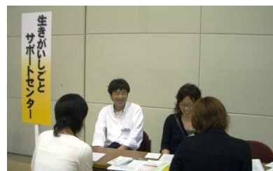
現場での合同説明会の様子