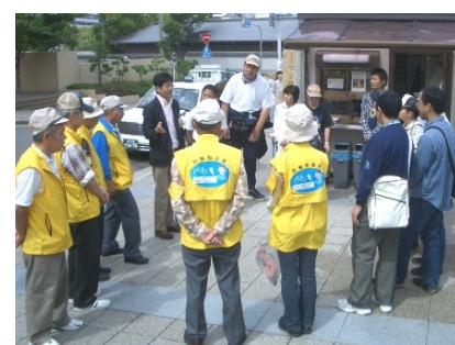
現場での合同説明会の様子

今後も、ワラビーとして、同協議会や外部組織とも連携し、よりニーズにあった形で、障がい者の就業をサポートしていくことができれば、と考えています。