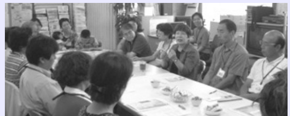
昨年度の CB 交流サロンの様子

ワラビーは昨年度末、兵庫県のコンペ審査に無事合格し、引き続き神戸東地域での生きサポ事業を担当することになりました。今年度もよろしくお願ひします。