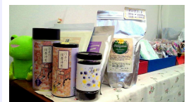
海苔やドッグフードなどの商品

扱う商品は、海苔や健康志向のドッグフード、新聞や布から作ったアクセサリなど多彩です。こうした商品も、できるかぎり指先を使う作業にすることで身体を意識的に使うように工夫しています。