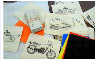
学習のときに使うカードなど

きるようになります。また、「運動」でも、動いたり動きを止めることを、自分で意識することで脳を働かせます。こうした学習を一人ひとりに合わせて、スモールステップで増やしていくことで着実な成果が得られます。