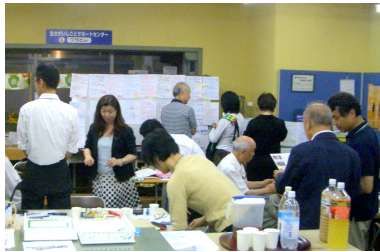
熱心な情報交換が行なわれました。

ニコニコ、和気あいあいの中で、次は各自の事業分析。シートに「やってよかった」、「今これが困っている」「こんなことに挑戦してみたい」を書き出し、併せて「提供できるもの」「提供してほしいもの」を考えます。グループ内発表を経て、最後は全員のシートを貼り出し、関心ある記述や何かを提供できそうな相手に、自分の名前を貼り付けて行きました。