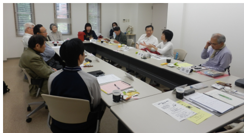
定例おしゃべり会