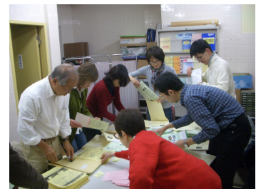
ワラビー誌の発送は、多くのボランティアさんの協力があります。